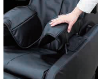
■折りたためるアーム部分

■ご購入にあたって この商品は、保証書を添付しております。保証書はお買い上げの販売店で所定事項を記入のうえ発行いたしますので、記載内容をご確認いただき大切に保存してください。この製品は日本国内専用ですので、日本国外への輸出と使用を禁止しています。[PROHIBIT THE EXPORT AND THE USE OF THE CHAIR OUTSIDE OF JAPAN.]この製品を日本国外でご使用になられた場合は、修理をお断りする場合があります。●印刷物ですので実際の色と多少違う場合があります。●商品改良のため予告なく一部仕様を変更することがありますのでご了承ください。●掲載の情報は本仕様と異なる場合があります。